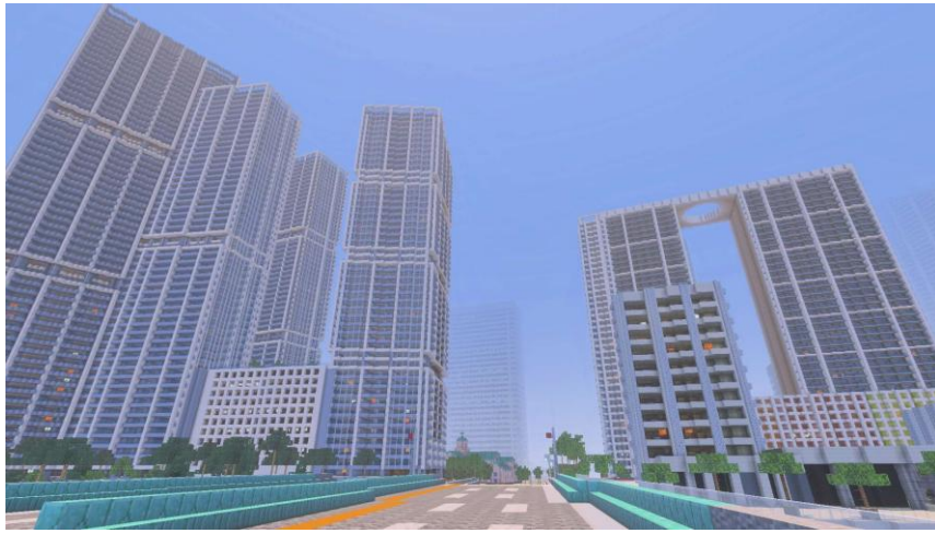
圧倒的なスケールと密度で描かれる、迫力の高層ビル群