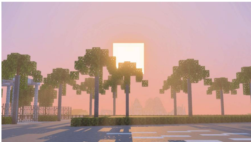
南国情緒あふれるヤシの木と夕焼けのコントラストが美しい夕暮れ時