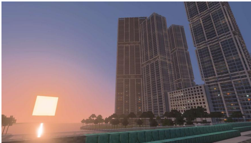
朝焼けがビスケン湾の水面に反射し、幻想的な雰囲気を出す