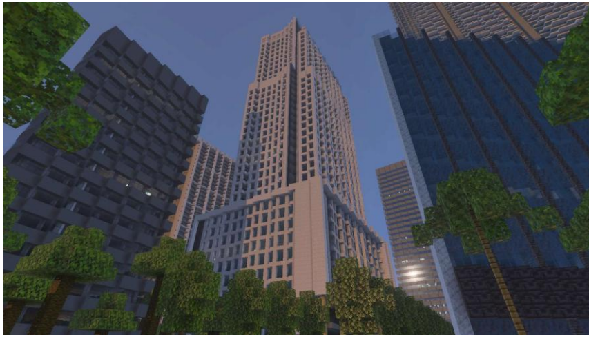
外観だけでなく内装まで作り込まれた、リアルな高層ビル建築