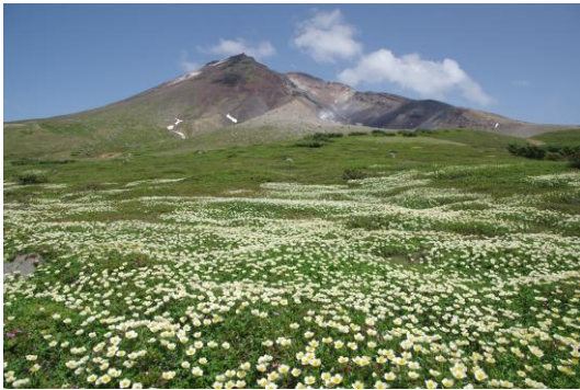
北海道・大雪山