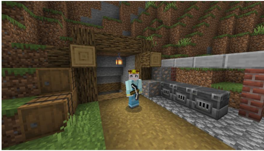
ライト付きヘルメットの鉱員、デニムのオーバーオールでマイニングも軽快に！