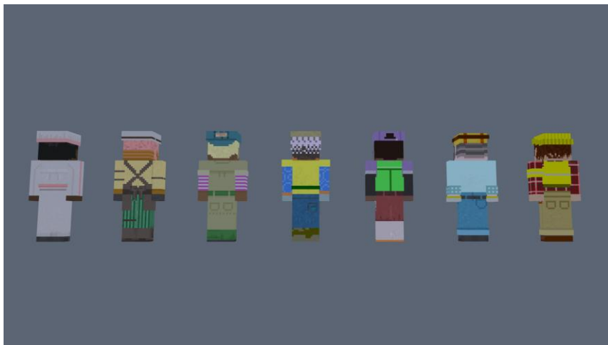
後ろ姿にも、こだわり抜かれたディテールが詰まっています