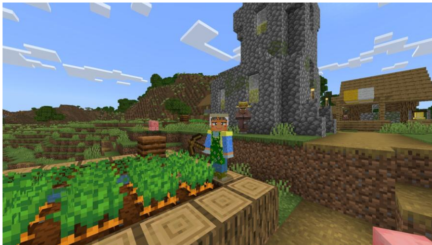
華やかな花柄エプロンをまとった農家、収穫作業がさらに楽しく！