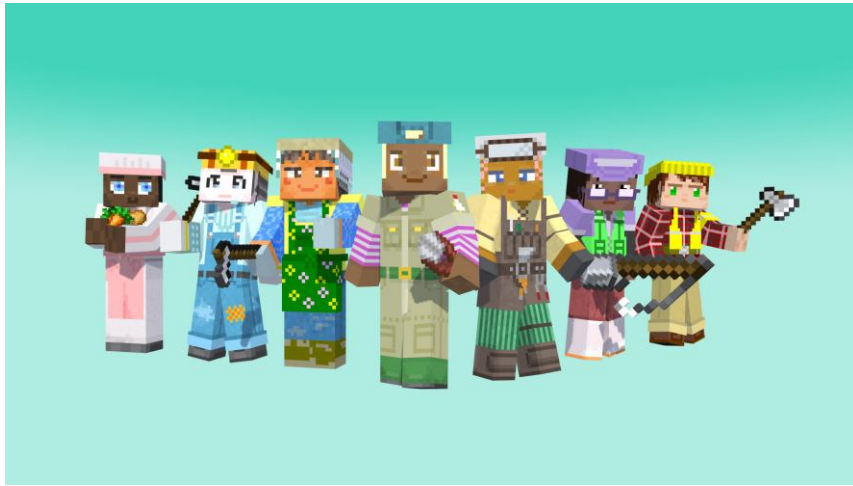
左から料理人、鉱員、農家、畜産農家、鍛冶師、釣り人、木こりの7種類を収録