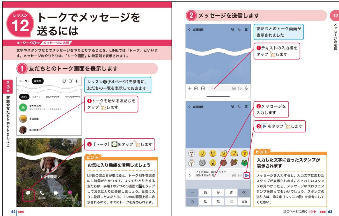
大きな文字と大きな画面で操作手順を丁寧に解説しています