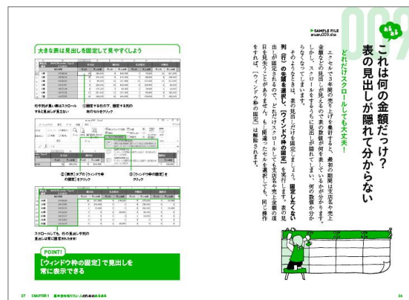
『あるあるで学ぶExcel仕事術』のページイメージ