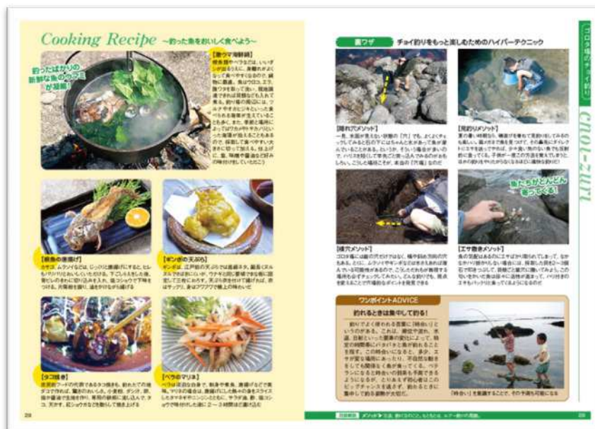
釣った魚はおいしく食べたい！ そのための調理のコツも紹介しています