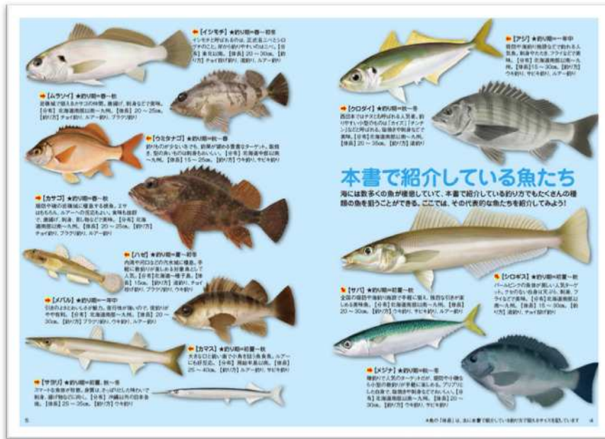
本書で紹介している釣り方で釣れるのは、食べておいしい魚ばかり

STEP 9 もっと釣りが楽しく上達するために…… 知って楽しい！ 役立つ雑学集