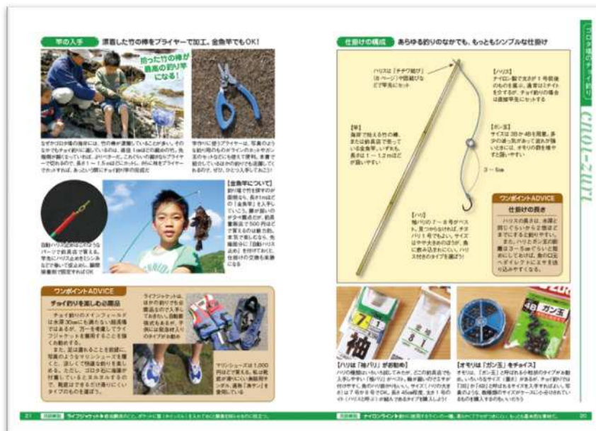
仕掛け図は大きなイラストで解説。フィールドで簡単にできる釣りの作り方なども紹介