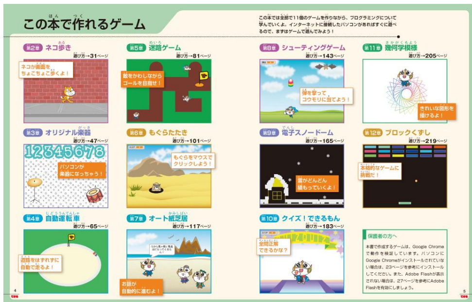
プログラミングに重要な概念を図表を使って分かりやすく解説。 プログラムの動きや用語、子どもに教えるコツがよく分かる