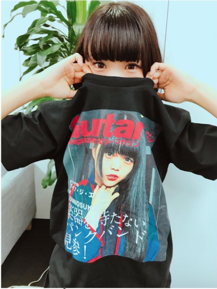
アイナ・ジ・エンド