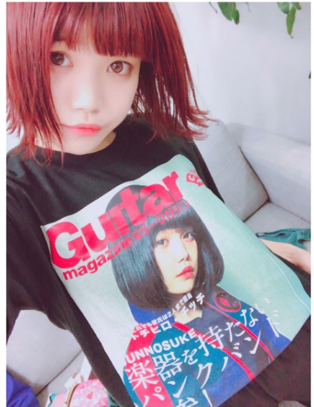
セントチヒロ・チツチ