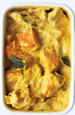
かぼちゃココナッツミルク煮

ホットドッグ用のパンに焼いたソーセージを挟み、「豆のチリコンカン」とピザ用チーズをのせてオーブントースターで焼く。