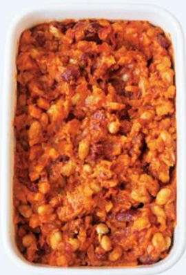
豆のチリコンカン