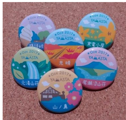
オリジナル缶バッジ(写真はイメージです)