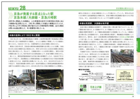
京急電鉄のすべて

京急電鉄、小田急電鉄それぞれの駅から、ターミナル駅や分岐する駅など、主要な駅を取り上げています。開業のいきさつや駅周辺の特徴、現在に至るまでの変化などを詳しく解説しています。構内の配線に特徴がある駅では、配線図も掲載しています。