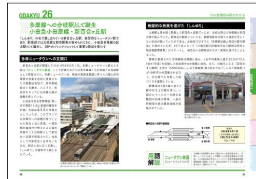
小田急電鉄のすべて