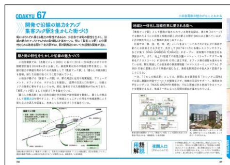
小田急電鉄のすべて