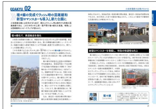
小田急電鉄のすべて