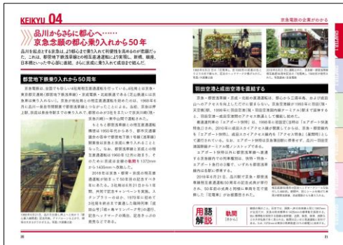
京急電鉄のすべて

鉄道会社は、電車を走らせているだけではありません。都市開発や事業の多角化、そして未来を見据えた活動まで、京急電鉄および小田急電鉄の企業としての「今」を切り出しました。