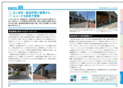
京急電鉄のすべて

第6章では、雑学的な切り口から鉄道会社を取り上げています。異分野への進出や新たな街づくり、さらにはおトクなきっぷまで、「これも京急だったのか!」「あれは小田急がやっているの?」と、読むと新しい発見に出会えることでしょう。