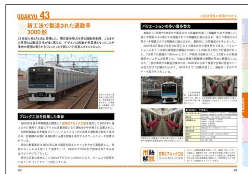
小田急電鉄のすべて