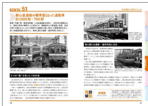
京急電鉄のすべて

鉄道会社を取り上げるうえで、忘れてはならないのが車両です。現在走っている車両はもちろん、これまで走っていた歴史的な名車まで、懐かしい写真を交えて取り上げています。