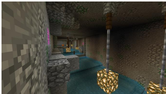
隠し部屋の一部。ここにたどり着くには……。