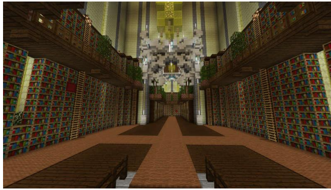
細部の装飾までこだわった美しい場内