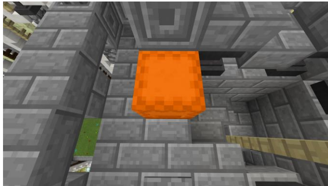
レコードはオレンジ色のシュルカーボックス内に隠されています