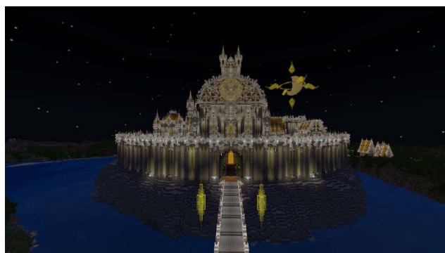
三日月をモチーフにしたお城が浮かぶ湖を中心に設計されたマップ

三日月をモチーフにした荘厳な装飾からなる幻想的なお城のマップです。その美しい世界を観光するだけでなく、マップ内に隠された5つのレコードを探し出し、城の奥に隠された隠し部屋を見つけ出しましょう！