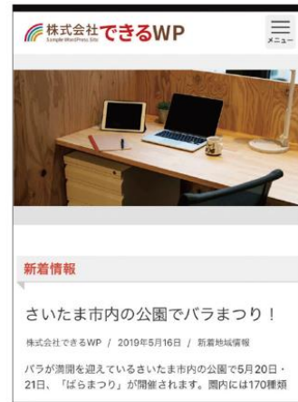
「Dekiruテーマ」のPC表示（左）とスマートフォン表示（右）。シンプルな作りで初心者にも好適