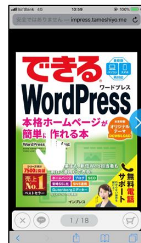
第1章をパソコンやスマホから無料で読める