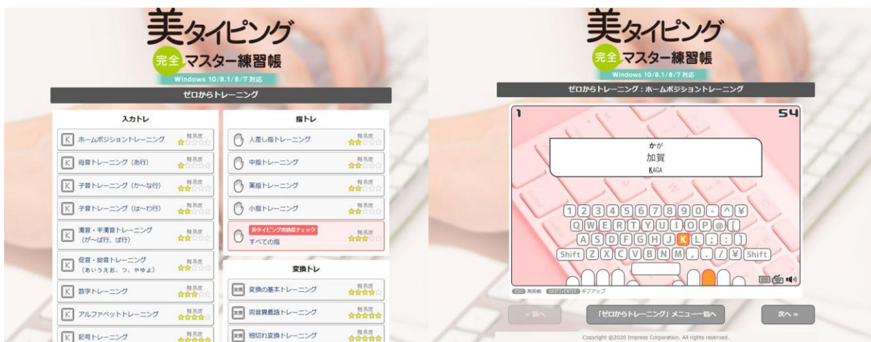
レベルに合わせて基礎を練習できる「ゼロからトレーニング」