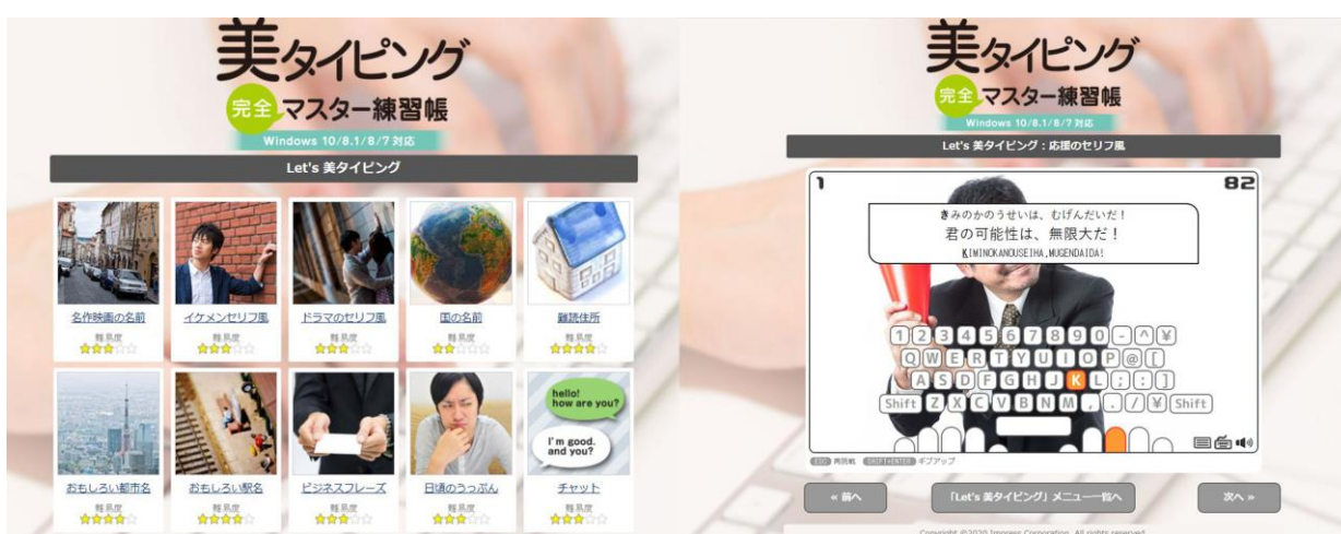
ユニークなワードで楽しく練習できる「Let's 美タイピング」