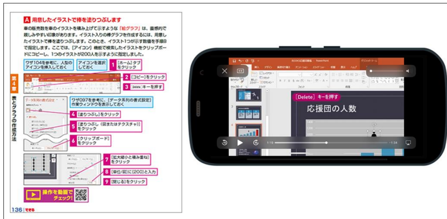
ワザの操作を動画で確認できる

一部のワザは操作手順を収録した無料動画が付いています。操作手順を確認できるため、理解がより深まります。動画は操作手順の最後に掲載されたQRコードをスマートフォンで読み取っていただくか、書籍内で紹介している動画のまとめページにアクセスすることで参照可能です。