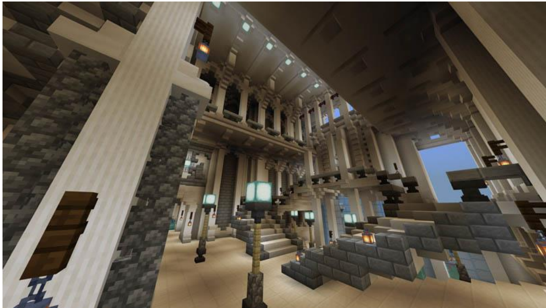
【Minecraft クリエイターチーム『Bergamot』について】