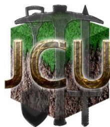
【Japan Crafters Unionについて】

【日本のMinecraftを世界へ】Japan Crafters Union( https://crafters-union.jp/ )は、マイクラフトゲーム内のストアにワールドやスキンパックを出品する、Minecraft公式のプロマイクラフターたちが集まるコミュニティ。日本のマイクラフターたちの技術力や発想を全世界に展開し、日本のクラフター文化を多くの人に伝え、海外からも注目されている。