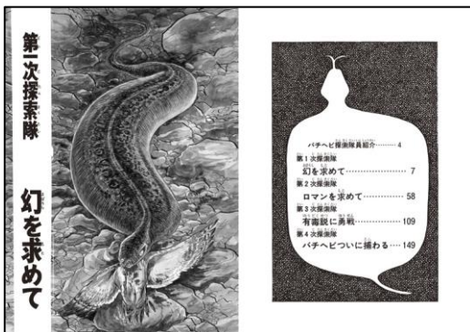
(『幻の怪蛇 バチヘビ』目次)

バチヘビ！ 黒褐色で長さ 50 cm、胴の太さはビール瓶くらい。その怪異な生物（別名ツチノコ）に人々はロマンと夢を求める。怪蛇探索に意欲を燃やす男たちの情熱を、自らの体験をもとに描いた矢口高雄の代表傑作！ そして、雄大な奥羽山脈の山中を舞台に、宿命の糸で結ばれた大熊コブダワラとマタギ犬シロベの熾烈な戦いを描いた名作『シロベ』を合本し文庫化！