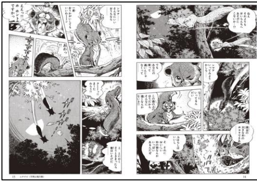
(「ムササビ〜空翔ぶ風呂敷」より)

判型: 文庫版(148×105 mm 背幅 33.4 mm) / 頁数: 738 頁 定価: 本体 1,500 円 + 税 / ISBN: 9784635048798 / 発行: 山と溪谷社 http://www.yamakei.co.jp/products/2820048790.html