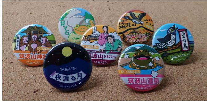
オリジナル記念缶バッジ（デザインはイメージ）

してメール（ヤマスタ事務局宛 yamasta-info@yamakei.co.jp ）にて応募ください。