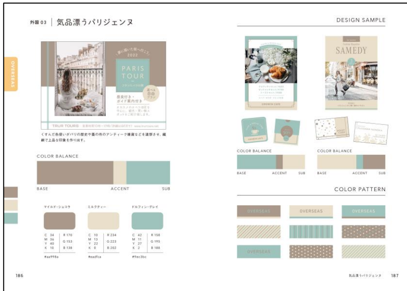
おしゃれなニュアンスカラーの配色。ファッションやインテリアにも活用できる

ファッションやインテリアでは「色を2〜3色にまとめる」のがセオリーとされていますが、その色選びに迷うことがあり、本書の配色が色を選ぶヒントにもなっています。このような点も、普段デザインにあまり縁がない、従来の配色本を手にとらない読者層からも支持を得るきっかけとなりました。