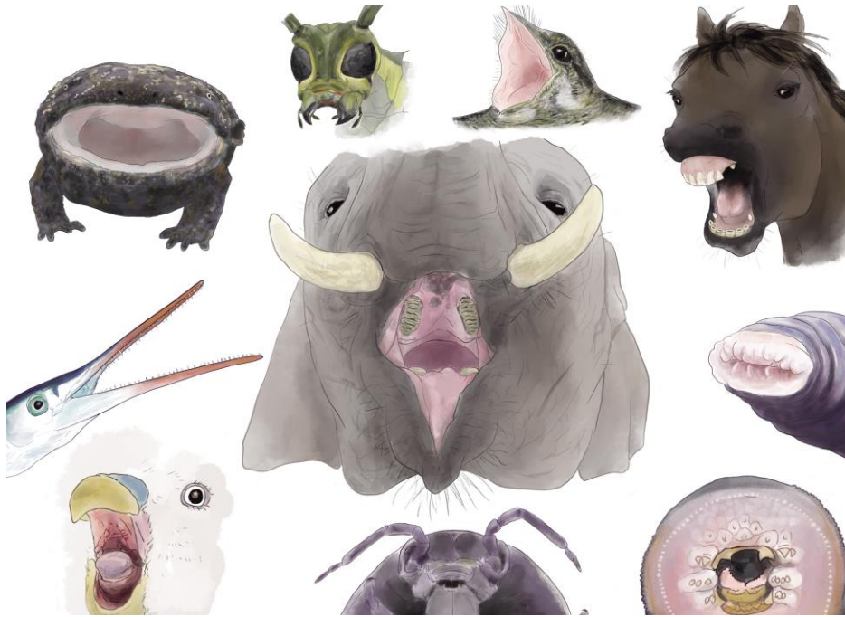
ぜんぶで52種の生き物の口を掲載