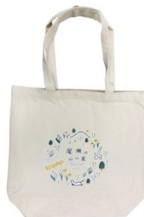
山小屋手ぬぐい（左）とトートバッグ（右）