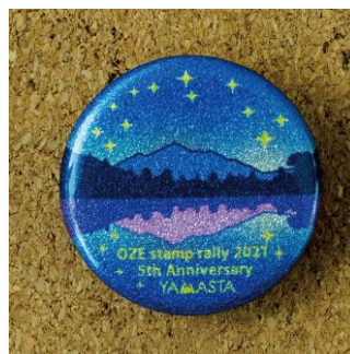
尾瀬の星空キラキラ缶バッジ

https://www.tokyo-pt.co.jp/oze/application/files/6516/2262/1662/2021TR-03Yamasta5.pdf