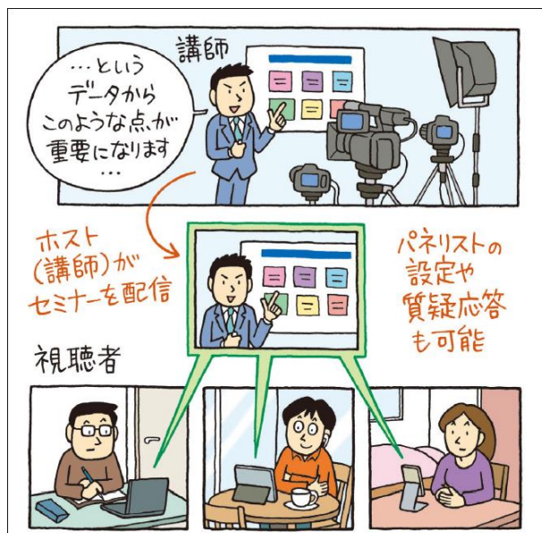
Zoomならウェビナー向けのさまざまな機能が利用できる

「ウェビナー」はインターネット上で開催される動画を使ったセミナーのことです。Zoomの有料機能を使うと、多くの参加者を集めた説明会や講演会、オンラインイベントなども手軽に開催できます。本書はウェビナーの開催方法や、ウェビナー中に役立つ機能も多数解説しています。