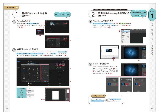
Day1_ 作品づくりの流れ