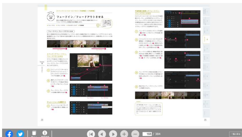
パソコンやスマートフォン、タブレットなど、端末を問わず閲覧可能