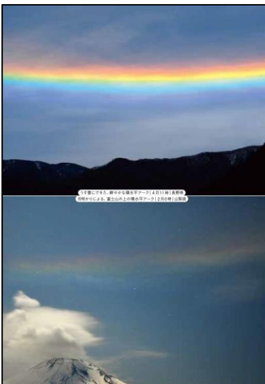
●鮮やかな虹色の現象の中で、最も美しいのが環水平アー ●環水平アー ●鮮やかな色彩に惹かれて感動するでしょう。ただし、まれに思われるのは生に数回程度で、ホウに生 ●鮮やかな色彩に惹かれて感動するでしょう。ただし、まれに思われるのは生に数回程度で、ホウに生 ●鮮やかな色彩に惹かれて感動するでしょう。ただし、まれに思われるのは生に数回程度で、ホウに生