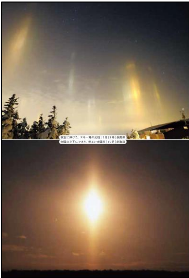
●空に伸びる、不思議な光の柱が ●光柱(イレイター)は、寒い空にみられる幻想的な光景です。昼間は太陽の光に、夜は月の光や星の光にのみ見えます。太陽の場合は太陽柱(シニャー)、月は月光柱(ムーンピラー)と呼ばれます。夜の寒さで雲がたまり、光柱をつくる。冬の到来を知るニュースにもなります。完全に晴れた空では見られず、雲は薄くないけれど、空がちょっと曇りやもやもやしているときに見えます。そのもやもやは氷(雲の結核)で、横雲向いてりりりと漂っています。そこいらが光が反射するのです。太陽や月の場合は、氷の下で反射して光が上下にできます。街灯の漁火の場合は、下で反射して空高く伸びます。上空に寒気がやってきたときチャンスです。ただ、ただでなく、春や秋でも薄く空に昇ることがあります。見られる時間は10分前後といつことが多いです。極寒地やスキー場では、ダイヤモンドが舞っているときに、すぐに近づく恐れがあります。