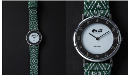
④文字盤：無地（白） / バンド：グリーン