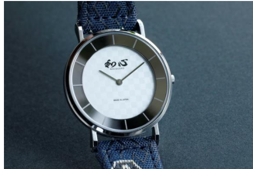
②文字盤：市松模様（白） / バンド：ネイビー