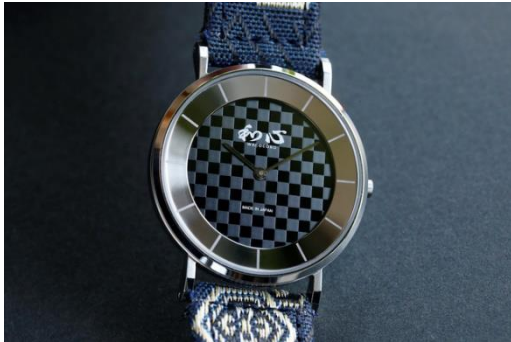
①文字盤：市松模様（黒） / バンド：ネイビー