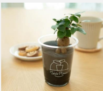
Table Plants ガジュマル ¥1,980-(税込)

POPUP ショップでは「GreenSnap」で人気のテーブルプランツ 5種類も販売します。テーブルプランツは土の代わりにスポンジを、鉢の代わりにクリアカップを使って育てる GreenSnap オリジナルの観葉植物のシリーズです。土を使っていないため、倒れても周囲が汚れず、ニオイや害虫の心配も少ない、テーブルの上にぴったりです。