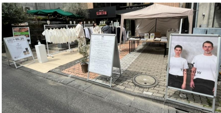
※3月19日～21日開催の様子

『TARROW TOKYO』は、品質よりも価格を重視した「売るための服作り」に主眼が置かれている状況を打破し、一人ひとりが必要な服を長く大切にを着る世界を作りたいという想いから誕生したブランドです。