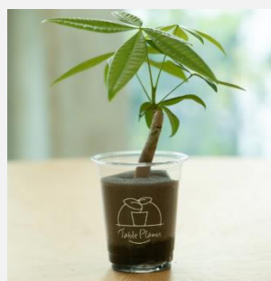
Table Plants パキラ ¥1,980-(税込)

育てやすく初心者にもおすすめ。沖縄ではガジュマルのことを「精霊が宿る木」として、神聖に扱われています。