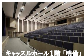
キャッスルホール1階「明倫」