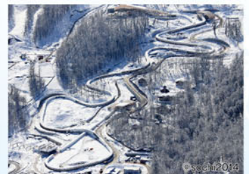
ボブスレー競技会場(マウンテンクラスター)