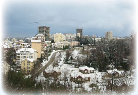
*写真は全てイメージです。

*混乗車は今後発表されるツアーを含みJTBオリンピック冬期競技大会応援ツアー内の他のコースと混乗となる場合があります。 *2/17ソチ出発時 早朝のため、朝食はボックスブレイクファースト(お弁当)になる場合があります。 *オリンピック観戦、鑑賞日のホテルから会場間移動は現地係員がご案内します。