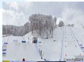
スキージャンプ競技会場(マウンテンクラスター)