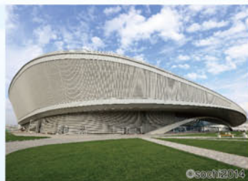
オリンピックパーク(コースタルクラスター)

パンフレット掲載ツアー、観戦可能競技 ※競技スケジュールは予告なく変更となる場合があります。