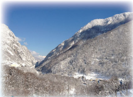
*写真は全てイメージです。

*混乗車は今後発表されるツアーを含みJTBオリンピック冬期競技大会応援ツアー内の他のコースと混乗となる場合があります。 *2/21ソチ出発時 早朝のため、朝食はボックスブレイクファースト(お弁当)になる場合があります。 *オリンピック観戦、鑑賞日のホテルから会場間移動は現地係員がご案内します。