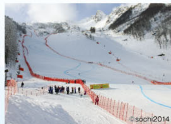
スキー競技会場(マウンテンクラスター)