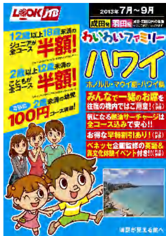
わいわいファミリー ハワイ

※ 上記以外の「わいわいファミリー」へご参加の2歳から11歳のお子様には「海外旅行まるわかりBOOK」をお渡しします。