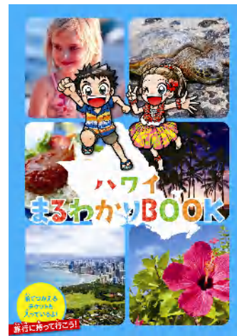
まるわかりBOOK ハワイ