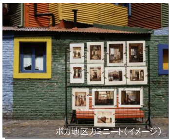
ボカ地区カミニート(イメージ)