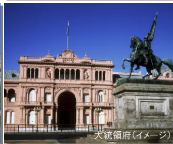
大統領府(イメージ)