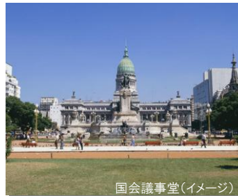
国会議事堂(イメージ)