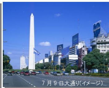
7月9日大通り(イメージ)