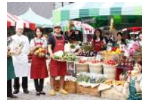
神川産の有機野菜が揃うオーガニックマルシェマーケット(イメージ)