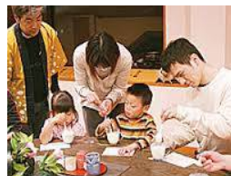
家族で豆腐作りに挑戦