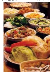
郷土料理や家庭料理(イメージ)

都心から80分で昔懐かしい雄大な日本の原風景に出会えます。 その中で農業体験やお食事は、格別な風情をお楽しみいただけます。