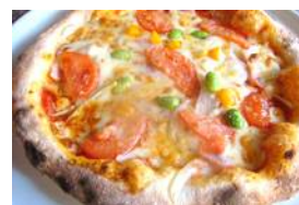
地元小麦を使ったピザ作り(イメージ)

都心から80分で昔懐かしい雄大な日本の原風景に出会えます。 その中で農業体験やお食事は、格別な風情をお楽しみいただけます。