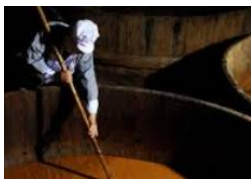
加工品の製作過程を見学