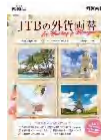
ウエディング用パンフ （A4見開き）