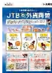
団体・電話予約用パンフ （A4ペラ両面）