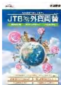
店頭用パンフレット （A4見開き）