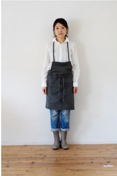
チノ エプロン (ショート)