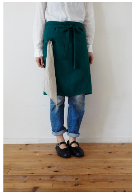
リネンギャルソン (ショート)