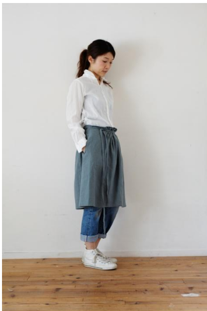
リネン巻きスカート