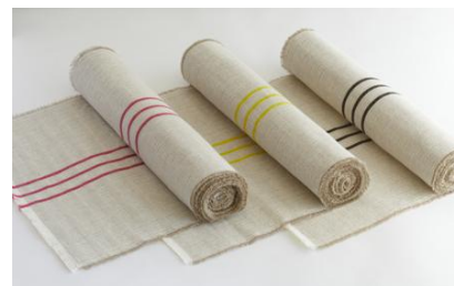
カットタオル (ハーフリネンストライプ)