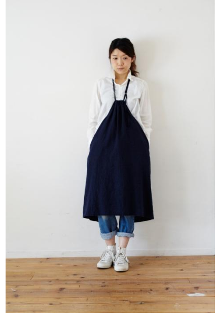
リネンギャザー胸あてエプロン (ロング)