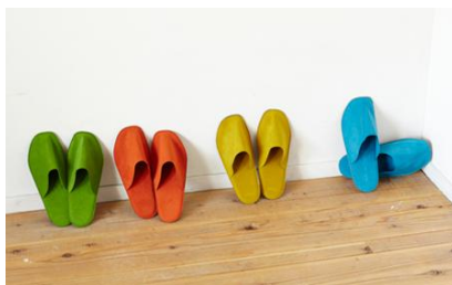
おりがみスリッパ