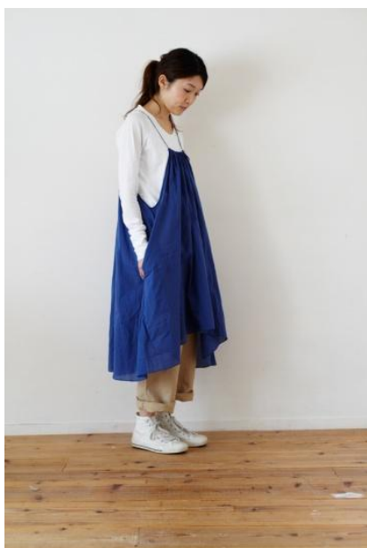
コットンキャミドレス (ショート)