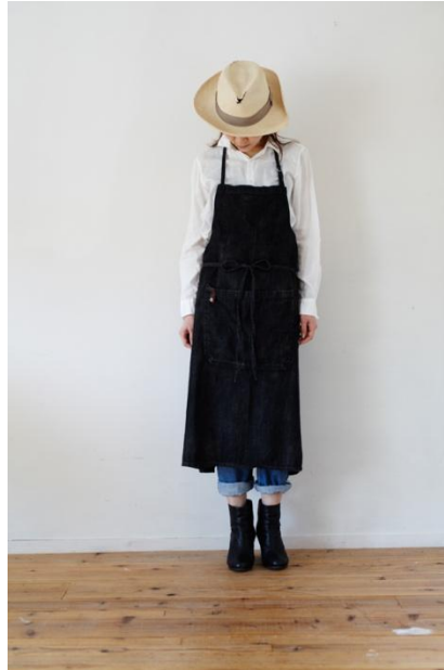
デニム胸あてエプロン (ロング)