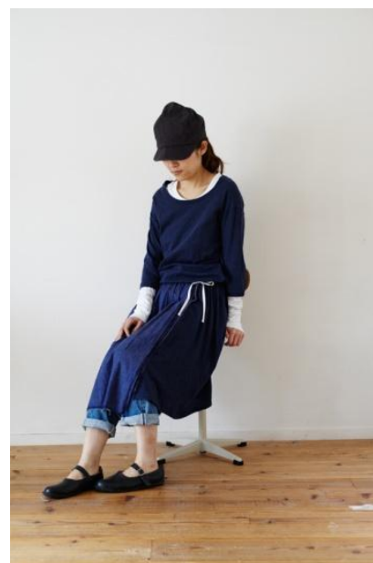
オーガニックコットンロンワンピース