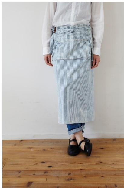
ビッコリーギャルソン (ロング)