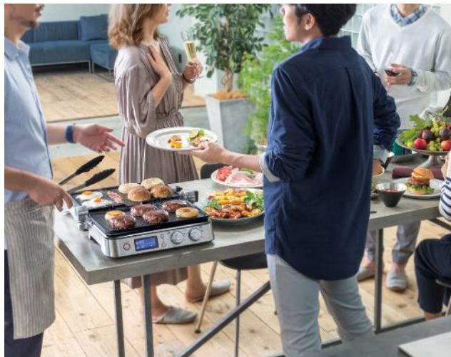
デロンギ マルチグリル BBQ & コンタクトグリルプレート (CGH1011DJ)