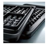
ワッフルプレート (CGH-WP)