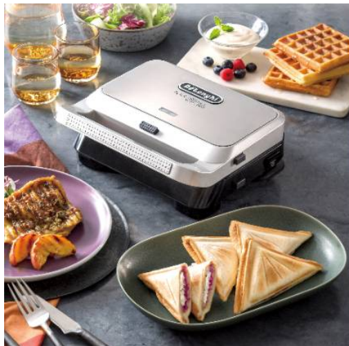
デロンギ マルチグリル エブリデイ サンド & ワッフルメーカー (SW13ABCJ-S)