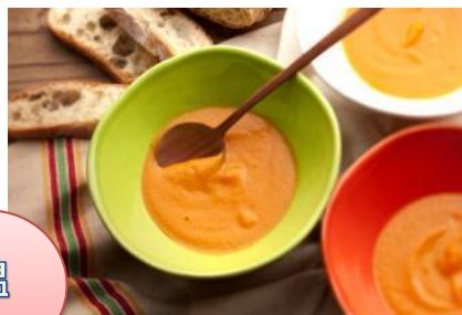
冷たいイタリアンスムージー 「スプレムータディメローネ」