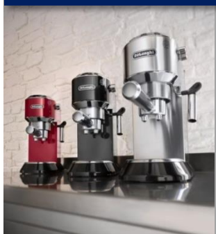
エスプレッソ・カプチーノメーカー

製品名称： デロンギ デディカ エスプレッソ・カプチーノメーカー (EC680M/R/BK)