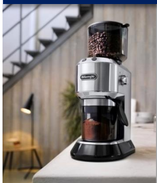
コーン式コーヒーグラインダー

製品名称： デロンギ デディカ コーン式コーヒーグラインダー (KG521J-M)