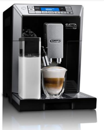
エレッタ カプチーノ トップ

製品名称： デロンギ エレッタ カプチーノ トップ 全自動コーヒーマシン (ECAM45760B)