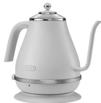
KBOE1220J-W ピースフルホワイト