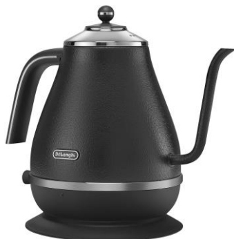
KBOE1220J-GY プレステージグレー