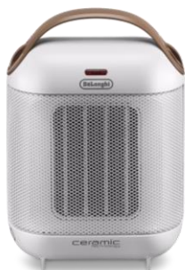
HFX30C11-IW アイボリーホワイト