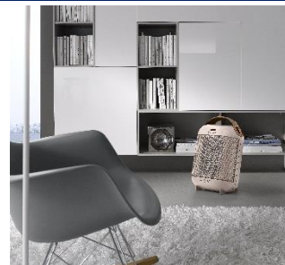
※写真はピンクです。