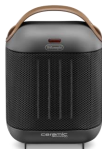
HFX30C11-AG アスファルトブラック