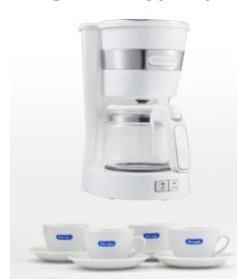
#コーヒーコース コーヒーメーカーとトニャーナ カプチーノ カップ&ソーサー4客セット