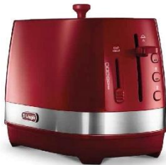
パッション レッド

今回発売するポップアップトースターは、外はこんがり、中はふわふわの美味しいトーストが焼けるのが特長で、焼きあがったトーストも簡単に取り出しやすく、お手入れも簡単と使い勝手にこだわった仕様となっています。カラーは、アクセントカラーとなる「パッション レッド」、清潔感のある「トゥルー ホワイト」、クールでシックな「インテンス ブラック」の3色展開です。また、既に発売している、最大5杯取りのドリップコーヒーメーカーやコンパクトサイズの電気ケトルと同じ色でそろえることで、キッチン空間を元気に彩ります。