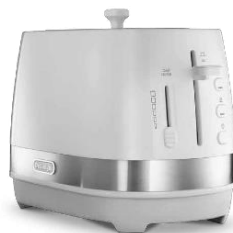
トゥルー ホワイト