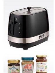
#トースターコース ポップアップトースターとオーガニック スプレッド&ピーナッツバターセット