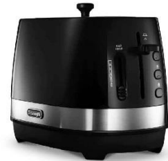
インテンス ブラック