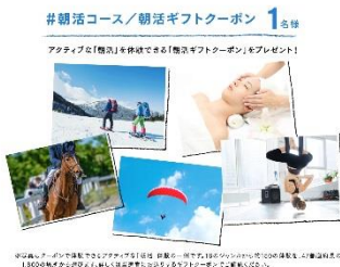
#朝活コース 朝活ギフトクーポン

※詳しくは、キャンペーンサイトをご覧ください。 http://active.delonghi.co.jp/cp2.html