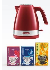
#ケトルコース 電気ケトルと オーガニックティーのセット