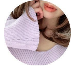
ありさ-福岡グルメ巡り-さん @fuk_gourmet_arisa