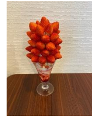
TOMA ログさん @tomalog.___0