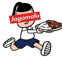
【福岡グルメ】jagamalu さん @jagamalu