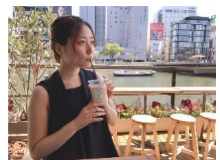
まどかじ@福岡グルメ+お酒さん @madocaji