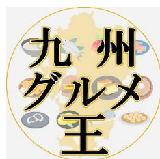
九州グルメ王さん @kusu_king