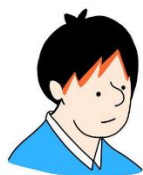
ひろ吉【福岡・天神・博多グルメ】さん @hirokichi.fukuoka