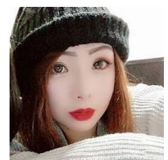
SHIHO 福岡グルメさん @shii3.gram