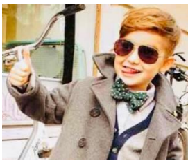
【福岡グルメ】クイシンボウさん @kuishinbou_fukuoka