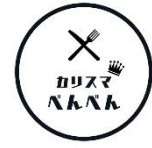
福岡グルメのカリスマさん @charisma_benben