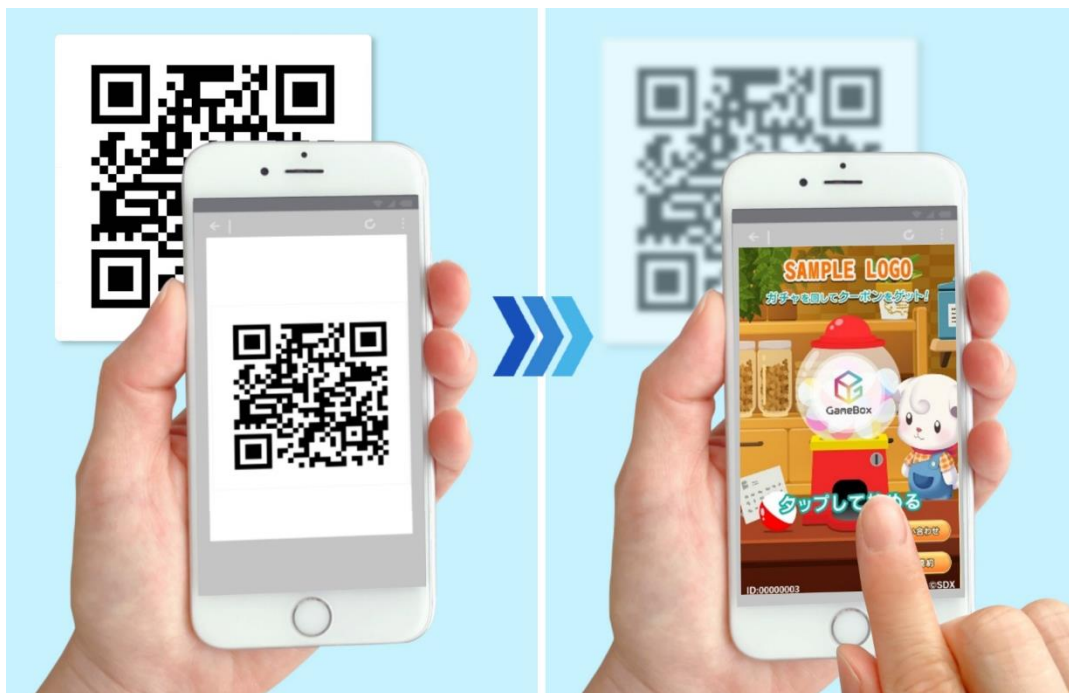
QR コードで読み込んで起動も可能

また、企業が保有する会員 ID との連携や自社ポイントとの連携、オンラインガチャ演出部分をくじ引きや的当てなど他の演出へ切り替えること、特典に AR コンテンツを配布したり、画像インセンティブを渡すことも別途調整することで実施可能になっています。