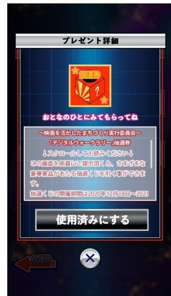
各種ごほうび (画像はイメージです)