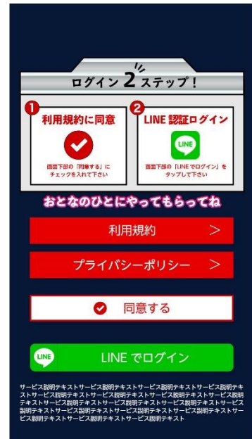
LINE ログイン (画像はイメージです)