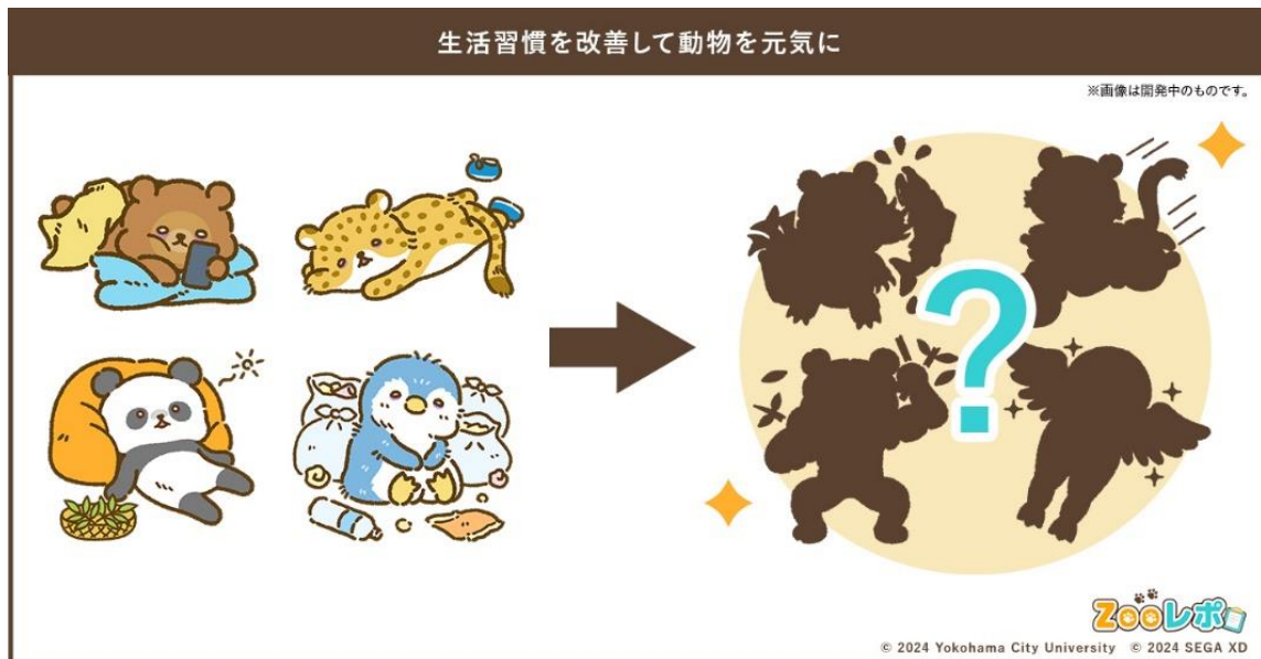
図2 「Zoo レポ」のキャラクターイメージ