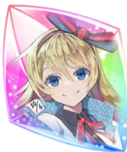
【夢のコード】アリス ～夢の姿～×60個