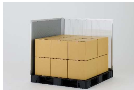
JIT パレットチャーター便 専用パネル（ダンカーゴシリーズ）