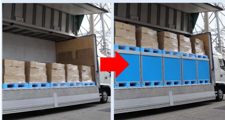
ダンカーゴの使用イメージ