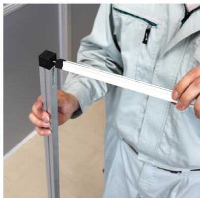
② 上の樹脂に横フレームを ねじ込み式で取り付ける。