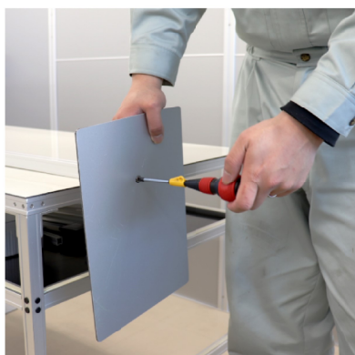
① 底板を縦フレームに取り付けて立てる。