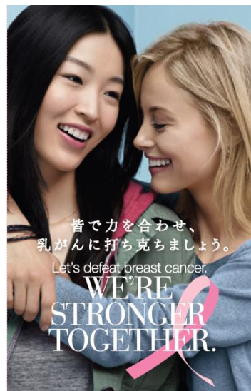
10月は、乳がん早期発見啓発キャンペーン月間です。

日本国内の8ブランドの各店頭で限定発売する支援製品などの収益の一部を、 乳がんにかかわる団体に寄付いたします。