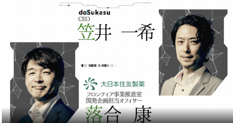
イベントでの do.Sukasu 出展資料