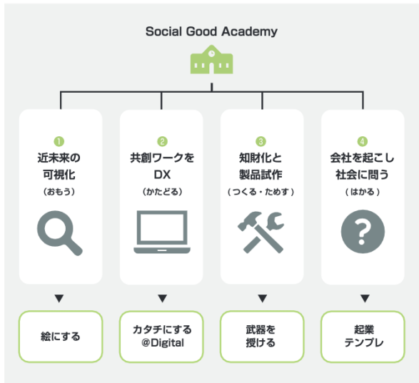
企業創業のプログラムの一例

初年度となる2021年は、日本国内複数拠点でAcademyを開校。仙台市、横浜市、神戸市にて起業・創業のプログラムの展開を目指していきます。講師には、シリコンバレーからヘルスケアVCのファンドマネージャー他、多彩な事業開発のプロフェッショナルを迎えて事業構想を行います。